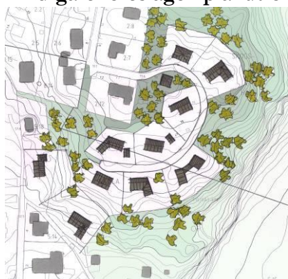
Exempel 1 på hur området kan bebyggas