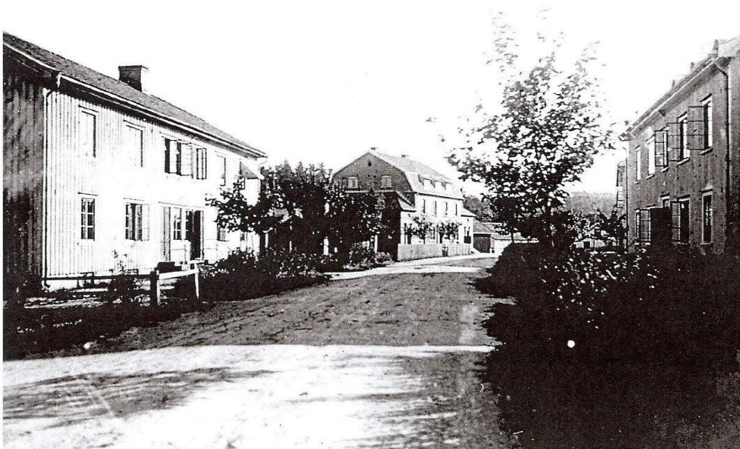
Bygatan med arbetarbostäder, 1930-tal. I bakgrunden tegelhuset där affären låg.

Ett konkret exempel på detta fann jag i företagsnämndens protokoll. I ett protokoll daterat 10/8 1949 ber arbetarnas representanter om att bolaget ska sätta upp ett staket kring dammen där barnen ofta leker. I ett senare protokoll, från 24/2 1950, tackar man Ek för att han satte upp det efterfrågade staketet (Rydals Manufaktur AB AI:3). Detta staket, uppsatt för att skydda arbetarnas barn sattes alltså inte upp av deras fäder med eget material utan man vände sig först till Ek. Därefter sattes staketet upp på Eks order och gissningsvis med hans resurser. Det står runt dammen som en symbol över den välvillige Ek, och de band som finns mellan honom och arbetarna förstärks. Varje gång barnen är där och leker fungerar staketet som en påminnelse om relationen mellan samhällets ledare och arbetarna. I det specifika nätverk som Rydal utgör får denna aktant sin betydelse som en beståndsdel i den patriarkala strukturen och fungerar som något som befäster Eks position som patriark (jfr Latour 1998:53).