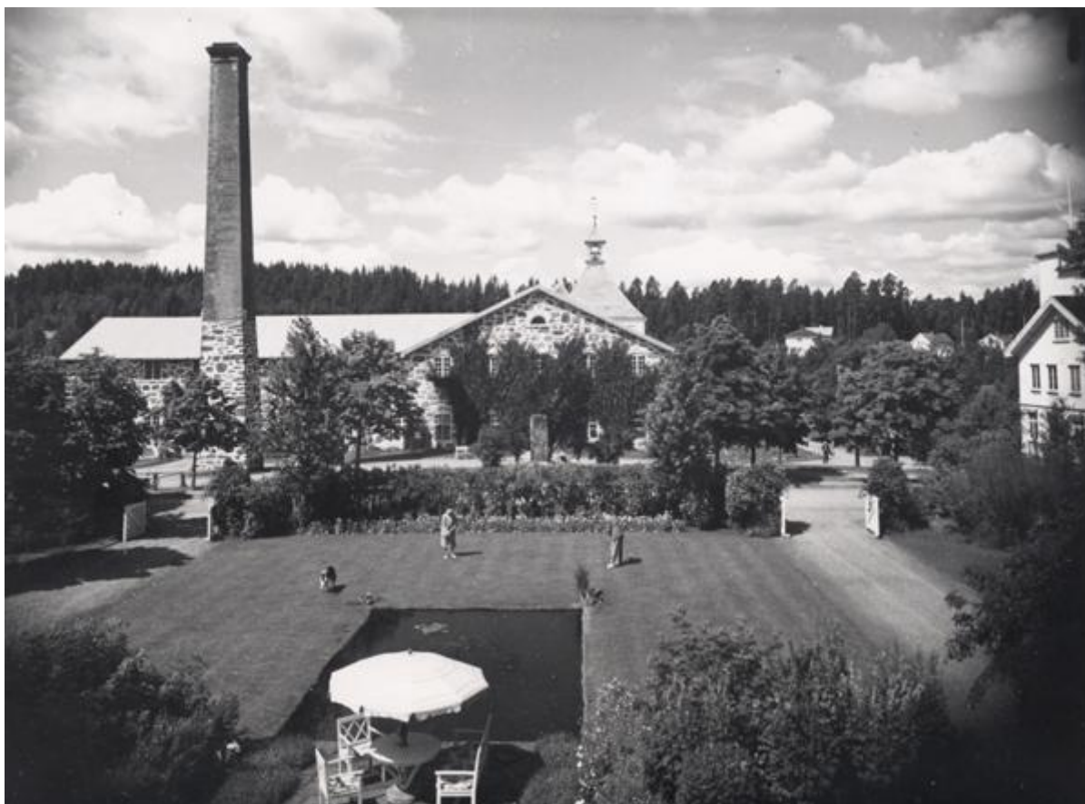
Paret Ek spelar krocket i trädgården.

som hade en formella makten. Det är nätverket Rydal som både definerar och utför disponentvillans funktion som bostad åt arbetsgivaren och patriarken Ek eftersom dess betydelse ”måste förstås utifrån de relationer med vilka de omges” (Wenzer 2008:87).