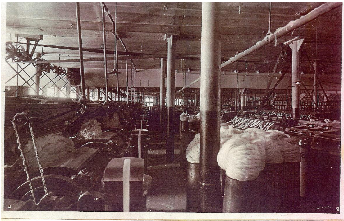
Interiör från kardrummet, 1940-tal. Till vänster står kardmaskiner, till höger sträckmaskiner och i bakgrunden slubbmaskiner.

Foucault pekar också på att syftet med panoptikon är att anonymisera en folkmassa eftersom det är lättare att övervaka individer. Han tar fabriken som exempel på hur man skapar en plats för varje individ genom att produktionen sker stegvis i serier. Fabriken interiör ska placera individerna så att de isoleras från varandra och samtidigt ska de vara synliga. Då kan arbetsledningen effektivt övervaka arbetarna men även bedöma dem, jämföra deras arbetsinsats och se deras styrkor och svagheter (Foucault 1987:147). I museet har man bevarat en del av interiören i det som var spinsalen och där står spinnmaskinerna på rad. Uttrymmet mellan maskinerna är trångt, precis lagom för en person att röra sig i sidled utmed maskinen för att övervaka garnbobinerna. Bullret från maskinerna när motorena är igång tar effektivt död på några försök att föra ett samtal. Genom att placera arbetarna enskilt med bullrande maskiner emellan dem isolerar man dem från varandra, gör dem synliga som individer och underlättar samtidigt övervakningen och bedömningen av dem, helt enligt Foucaults tanke ovan.