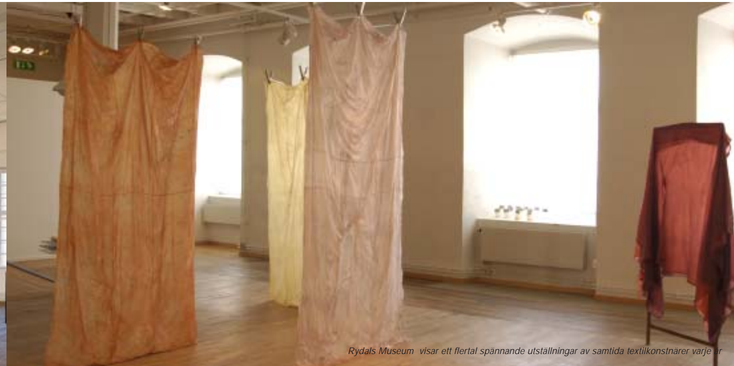
Rydals Museum visar ett flertal spännande utställningar av samtida textilkonstnärer varje år

- a working textile museum in a fascinating environment. Here, on the banks of the River Viskan, Sven Erikson built the first spinning mill in the Sjuhärad region, importing not only the machines, but even the cast iron and the supervisors he needed from England and forming a community around the factory, complete with worker's cottages and school.