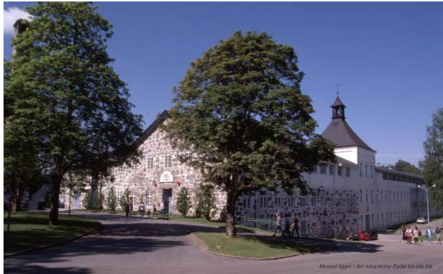
Museet ligger i det natursköna Rydal bla bla bla

In ther Ausstellung "Der Faden, der nie abriß" begegnet der besucher der textilen und technischen geschicchte der region vvom 16. Jh. biss