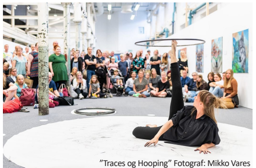
"Traces og Hooping"