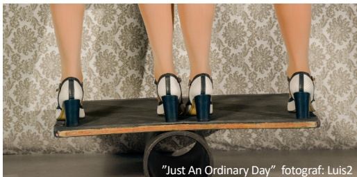
"Just An Ordinary Day"