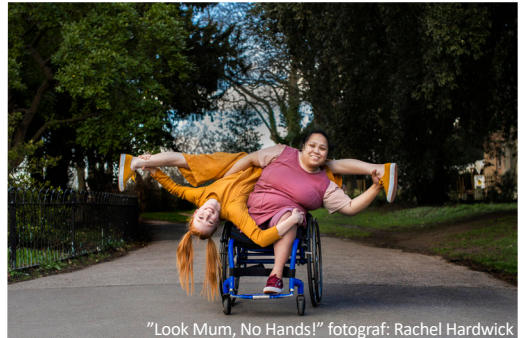
"Look Mum, No Hands!"