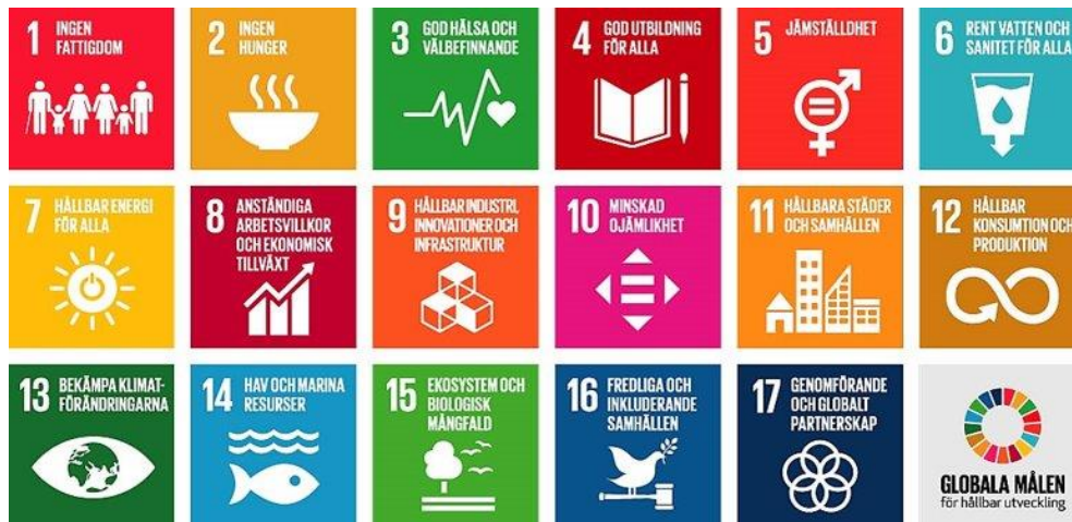
Figur 1. De globala hållbarhetsmålen i Agenda 2030

Agenda 2030 är en agenda för hållbar utveckling som togs fram av Förenta Nationerna år 2015. Agendan innehåller 17 mål som ska uppnås till år 2030. Målen är odelbara och kopplade till varandra. Det vill säga att alla mål är lika viktiga och att framgång för ett av målen ger positiva effekter på andra mål.