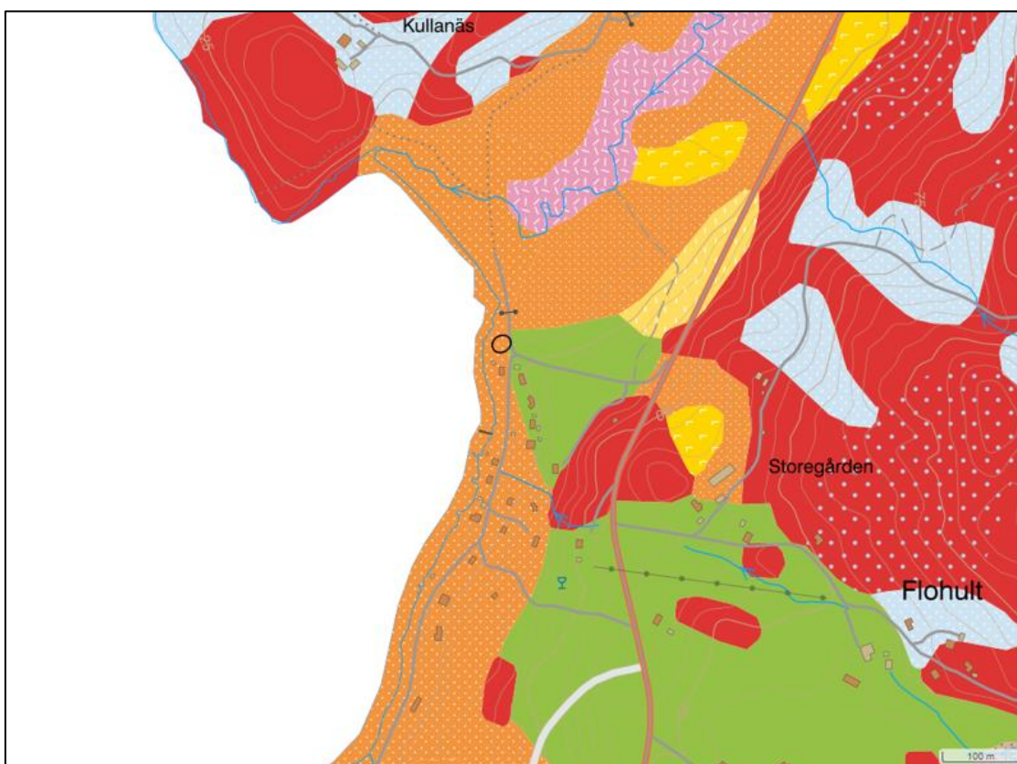
Figur 2. Jordartskarta från SGU med ungefärligt läge för planerad schaktgrop för kopplingsbrunn (inom svart cirkel).