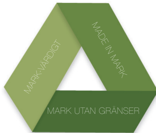
Attraktivitetsplanens tre utvecklingsområden samlar kommunens framtida utvecklingsfrågor och förtydligar det strategiska arbetet. Utvecklingsområdena överlappar varandra och flera utvecklingsfrågor återkommer inom mer än ett utvecklingsområde.